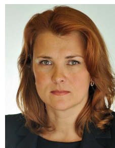
Алина Розенцвет Генеральный директор Национального рейтингового агентства (НРА)